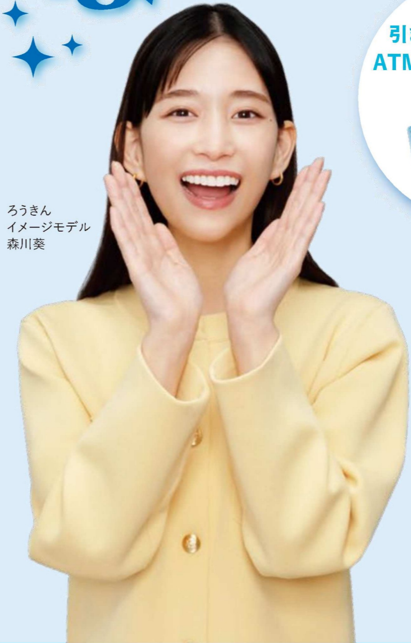
ろうきん イメージモデル 森川 葵